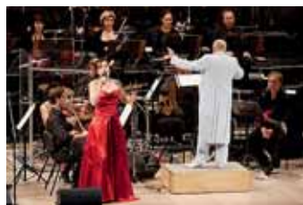
DVA VYPRODANÉ prosincové koncerty Symphonic Queen měly velký ohlas u publika i orchestru, sólistům a dirigentovi se dostalo ovací vestoje.

Pro velký zájem filharmonie přidává ještě jeden koncert,