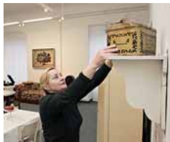
ZLÍNSKÝ ZÁMEK nově poskytne prostor i expozici Bydlení v baťovském Zlíně.

Nové využití zámku město hledá kvůli plánovanému přesunu Muzea jihovýchodní Moravy i Krajské galerie