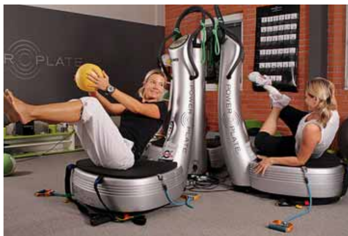
POWER PLATE. Cvičení na vibrační plošině je výborné na formování těla, lekce trvá pouze půl hodiny.

Sportcentrum Maty nabízí takové možnosti, jako jsou schwinncycling (cvičení na stacionárních kolech), alpinning (cvičení na pásových