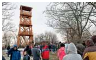
NIVNICE byla jedním ze 6 míst, kde byla den před koncem roku otevřena nová rozhledna.

Nad každou z těchto obcí vyrostla 13 metrů vysoká dřevěná rozhledna ze smrkové kulatiny. Z nich je výhled na